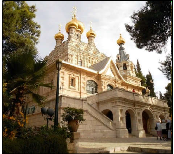
Храм св. Марии Магдалины.