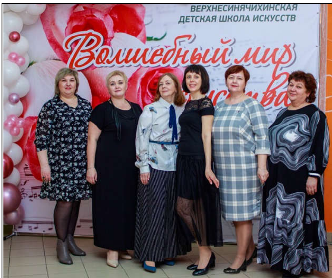
Педагоги художественного отделения ДШИ

В 2023 году Верхнесинячихинская детская школа искусств отмечает 45-летие. За эти годы педагоги школы воспитали немало талантливых учеников, не раз порадовали жителей и гостей поселка прекрасными концертами, выставками и мас-