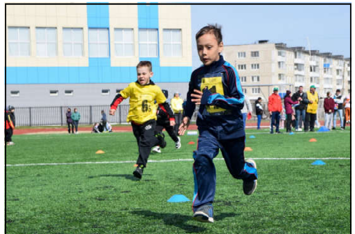
2 забег детские сады