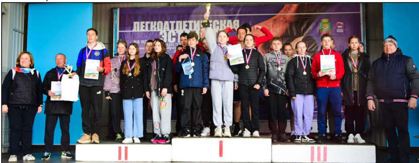
5 группа ВССОШ 3, ВССОШ 2, Деевская СОШ