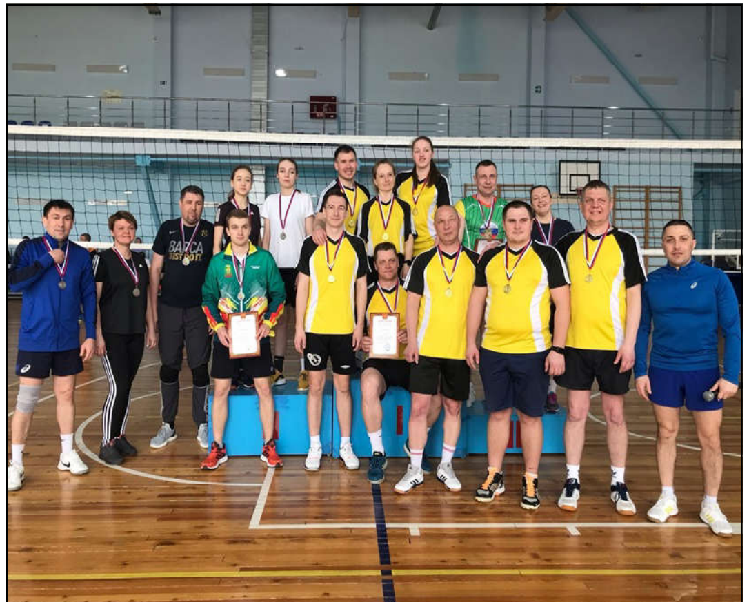
слева направо МБУ ФСЦ, Управление образования, ДЮСШ МО Алапаевское

первую позицию занимает команда ООО «АУЖД».