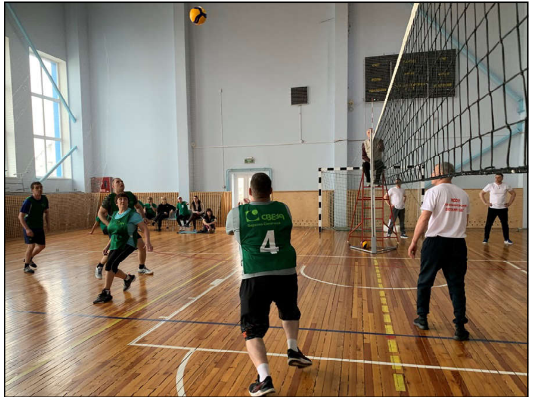
Свеза в борьбе за выход из группы

По итогам трех этапов в общекомандном первенстве положение команд выглядит так: в первой группе на третьем месте команда «ДЮСШ МО Алапаевское», на втором месте МБУ «ФСЦ» и первое место удерживает команда «Управление образования». Во второй группе на третьем месте расположилась команда «Заринской СОШ», второе место у команды «Арамашевского детского сада» и