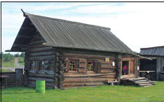
Крестьянская усадьба XVII века