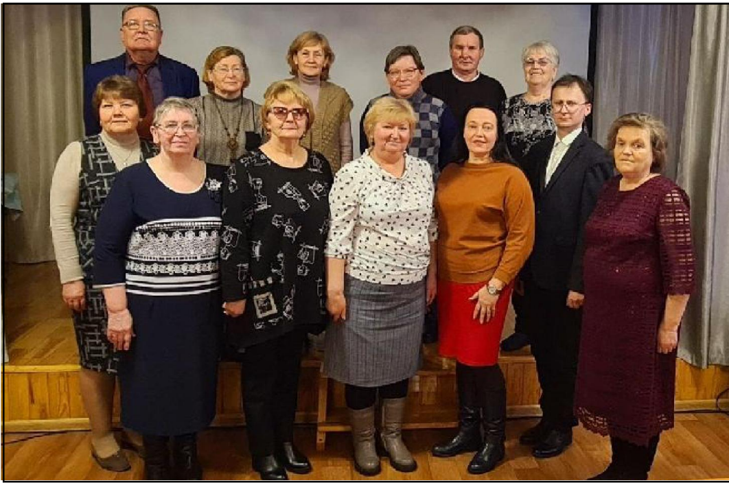
Члены литературного объединения «Вдохновение»