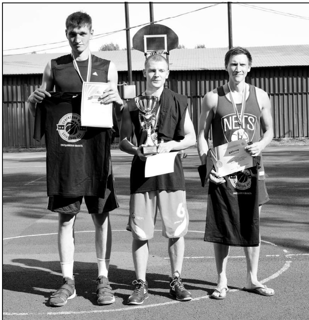
Мужчины команда «Саня и Миньоны»

В мужском турнире победителями стала команда