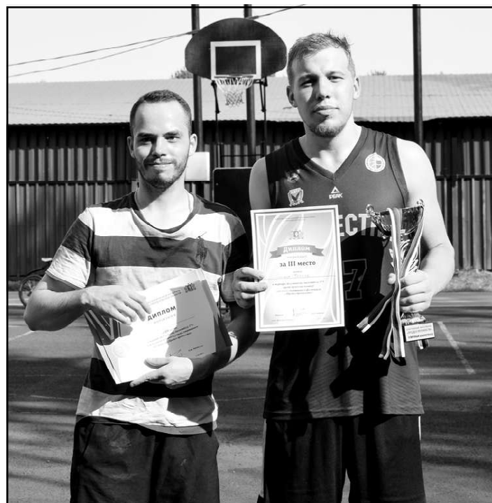
Мужчины команда «Синьча Флейва»

Автор статьи: Демерджи-Оглы Владислав