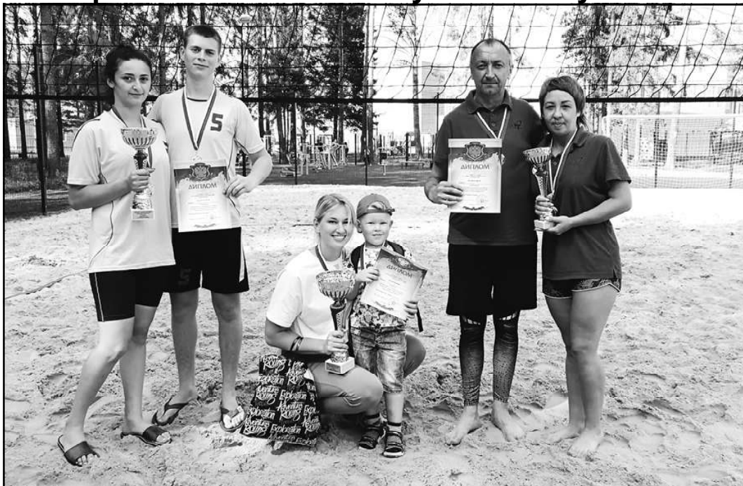
Победители и призеры среди смешанных команд слева направо Туринск, ФСК Взлёт, Орион

В минувшую субботу 24 июля в пгт. Верхняя Синячиха на площадке для пляжного волейбола лесопарка «Орион» состоялось Первенство по пляжному волейболу в муниципальном образовании