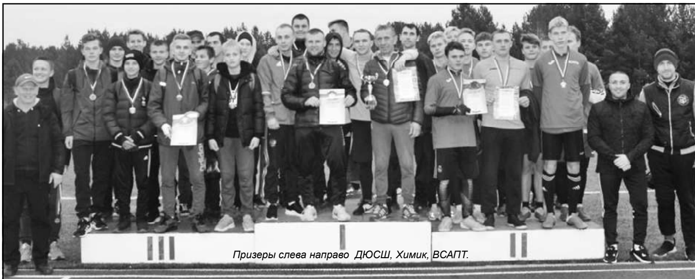
Призеры слева направо ДЮСШ, Химик, ВСАПТ.

В минувшее воскресенье 11.10.2020 г. На стадионе «Орион» пгт. Верхняя Синячиха состоялось закрытие футбольного сезона в МО Алапаевское-2020 г.