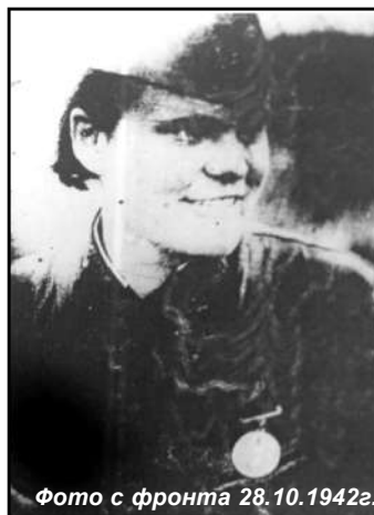
Фото с фронта 28.10.1942г.

1942 года Лощевского сельского совета Ржевского района Калининской области под сильным пулеметным огнем противника, не замечая вокруг разрывавшихся мин и снарядов, бесстрашно, решительно и быстро перевязала более 100 тяжело раненых бойцов и командиров и тем