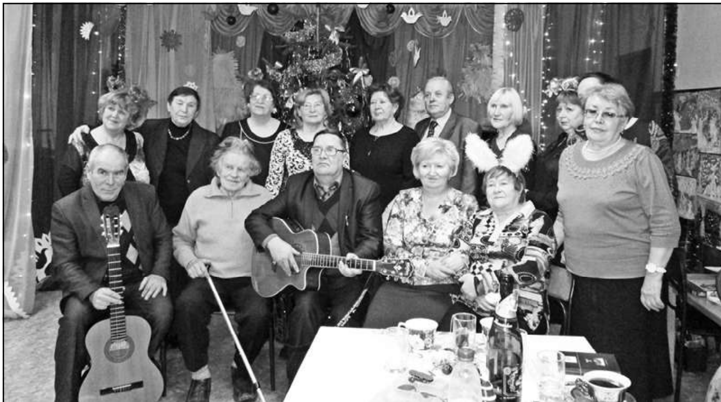
Предновогодняя встреча в детской школе искусств поселка Верхняя Синячиха. Декабрь 2014 года.