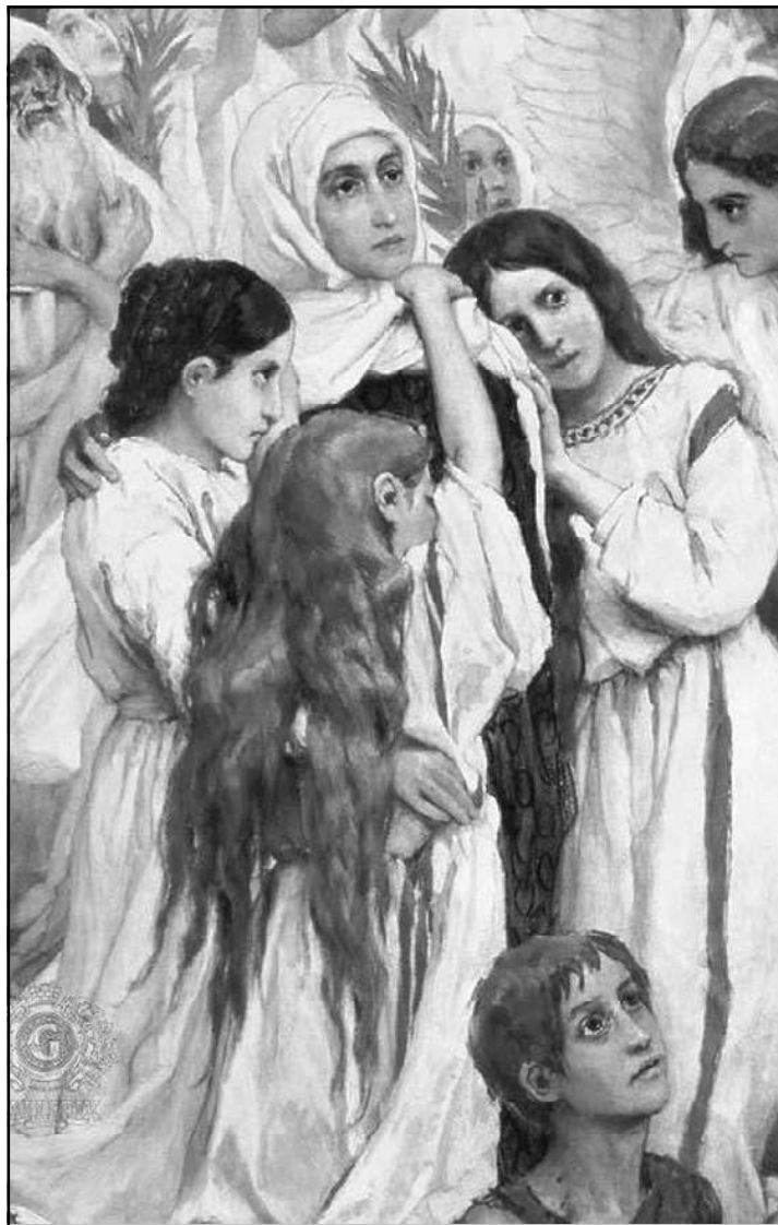
Вера, Надежда, Любовь и мать их София. «Радость праведных о Господе. Преддверие рая». Фрагмент росписи Владимирского собора в Киеве. Живописец В.М. Васнецов.

фии, Кондак мучениц, Молитва и акафист Святым мученицам вере, Надежде, Любви и матери их Софии, Величание мучениц Веры, Надежды, Любви и матери их Софии.