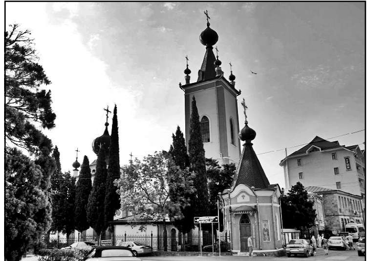
Храм всех Крымских святых и великомученика Феодора Стратилата в г. Алушта, Крым.

написанное на стене церкви красками. Стрела попала в правое плечо святого и, по преданию, по стене потекла кровь. Те, кто жили в здании, удивились этому факту, но не покинули здания церкви. Через некоторое время все, жившие в церкви, скончались, а это было около двадцати семей. Причины болезни остались невыясненными, при этом жители окружающих домов были живы и здоровы.