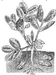
Рис. 128. Китайский орех, (около 1/2 натуральной величины).

сами сажаются в землю. Очень остроумно и целесообразно!