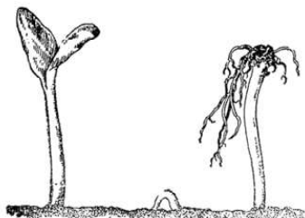
Рис. 124. Всходы тыквы (1/2 натуральной величины).

Впрочем, некоторое питание, вероятно, даёт хлорофилл стебелька. При этих опытах у меня однажды получилась растущая вверх корнями тыквочка с развитыми зелёными семенодолями, у которых лишь самые кончики были зажаты в земле. Эта тыквочка жила долго — недели три — и смогла даже дать пару листьев.