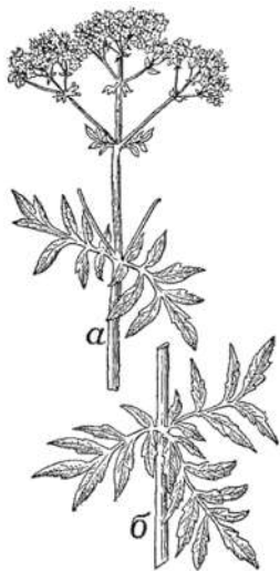
Рис. 115. Валериана ( Valeriana officinalis ): а — нормальный экземпляр, б — ненормальная, тройная мутовка листьев.

встречаются экземпляры с очередными (т. е. спирально расположенными) листьями, а также с мутовчатыми, по три листа в каждой мутовке. Разыскивать эту последнюю редкую разновидность было в своё время моей специальностью