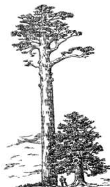
Рис. 104. Кедровая сосна: сибирская и европейская.

приспособившийся к самому суровому климату.