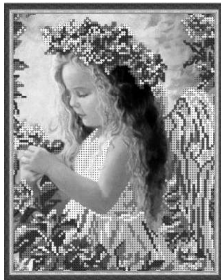
Фея - Ангел Цветы сакуры