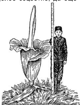
Рис. 90. Аморфофаллюс титанический.

Гораздо больше сходен с аморфофаллюсом — аройник восточный ( Arum orientale ), водящийся у нас в южных областях: в Крыму, на Кавказе и кое-где немного северней. Мои крымские школьники называли этот аройник «змеиным ядом», но уже не знаю, насколько это