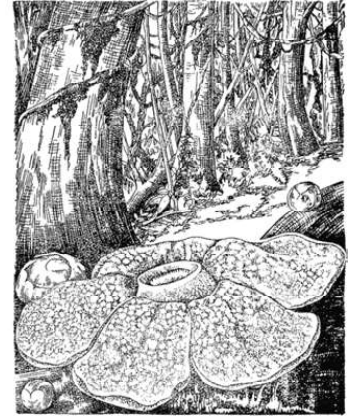
Рис. 89. Раффлезия Арнольди.

Москвы до Константинополя. Площадь острова около 480 тысяч кв. километров, т. е. равна примерно всей Германии. Размеры внушительные. Главное население острова — малайцы. Их там живет около 4 миллионов. Это совсем не густо. Соседний остров Ява заселен примерно в 30 раз гуще. Малайцы, эксплуатируемые владеющими островом голландцами, вымирают и вырождаются.