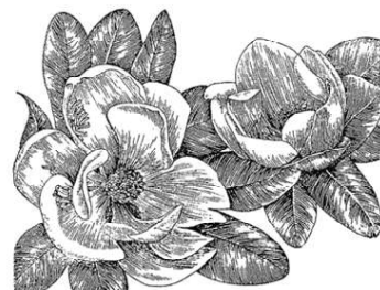
Рис. 88. Ветка магнолии крупноцветковой.

дереве распускаются огромные белые цветы почти в тарелку величиной (около 25 сантиметров в диаметре). Цветы сильно пахнут ванилью и лимоном. Запах напоминает переслащенное кондитерское мороженое.