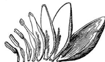
Рис. 78. Тычинки и лепестки белой кувшинки.

ками меда или просто посидеть в укромном уголке, копошась в тычинках, вываливаются в пыльце одного цветка и переносят её на рыльца других цветков. Подобным образом происходит опыление всех скольких-нибудь ярких, красивых цветов. Их яркость и красота для того и служат, чтобы приманивать насекомых.