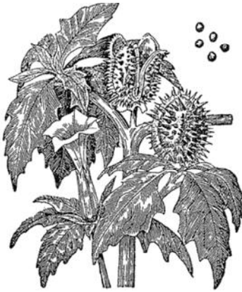
Рис. 70. Дурман ( Datura stramonium ).

И белена и дурман принадлежат к семейству Пасленовых ( Solanaceae ), к которому относятся ещё три всем знакомых растения: картофель, — одно из полезнейших растений в свете, томат и сомнительной полезности табак. Как многие члены этого семейства, белена и дурман сильно ядовиты. Особенно ядовиты их семена. С раннего детства у меня сохранилось воспоминание.