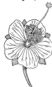
Рис. 67. Цветок баобаба (около 1/4 натуральной величины).