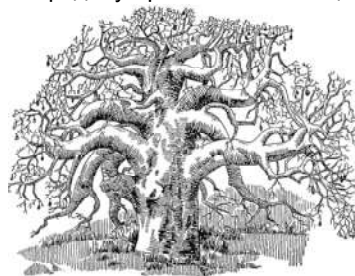
Рис. 66. Баобаб ( Adansonia digitata ).

Из близких к просвирникам знаменитостей тропической флоры назовем африканский баобаб ( Adansonia digitata ) — развесистое дерево с толстым (до 12 метров диаметром) стволом. Прежде по толщине стволов возраст баобабов оценивался до 6000 лет; но они оказались много моложе, так как с необыкновенной быстротой растут в толщину. В период засухи баобабы сбрасывают листву, как наши деревья зимой, но в дождливое время года покрываются лапчатыми листьями и крупными жёлтыми цветами до 12 сантиметров диаметром. Плоды их съедобны, но не очень вкусны и питательны, так что местное население чаще предоставляет их обезьянам. Лёгкая древесина, кора, смола, листья и даже цветы используются населением для разных надобностей. В дуплах могучих стволов нередко устраиваются жилища.