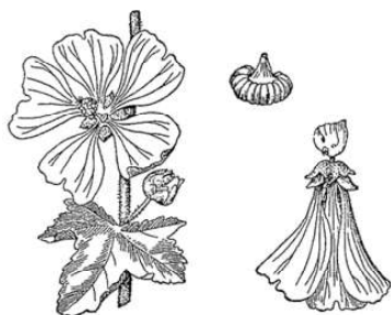
Рис. 64. Хатъма ( Lavatera thuringiaca ).

Обычно детвора любит есть «просвирки» т. е. незрелые плоды этих растений, имеющие форму круглой лепешечки, окруженной кольцом незрелых семян. Меня в раннем