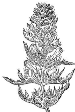
Рис. 61. Марьяник полевой ( Melampyrum arvense ).

Вторая загадка из области распространения сорных трав была знакома мне ещё с ранней юности. Есть так называемый марьяник полевой ( Melampyrum arvense ), близкородственный и сходный с распространённой в наших лесах «Иван-да-Марьей» ( Melampyrum nemorosum )