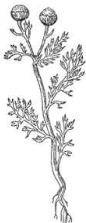
Рис. 58. Пахучая ромашка ( Matricaria suaveolens ). Маленький экземпляр в натуральную величину.

На моей памяти пахучая ромашка заполнила б. Тульскую губернию. Я отлично помню, как отец мой ездил на